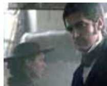
マーガレットとジョン (BBC映画より)

第に愛するようになる。社会問題と二人の恋愛が平行して物語は進む。ジョンの恋の行方は最後の最後まで分からない。