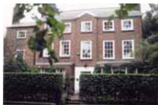
ヒースウェイト(ナッツフォード): 育った家