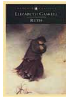
ペンギン版の表紙より

ルースの前に、自分を捨てた男が現れる。ベリンガムの求婚を彼女が拒否したのは、彼との間に、魂の深さにおいて、大きな隔たりを感じたからだ。やがて彼女の過去が明らかになり、真実を隠していたことを責められたベンスンは、「ルースのような女性には、贖いの機会が与えられるべき」と言明する。犯した罪は同じなのに、なぜ社会は男には寛容で女には冷酷なのか。人間の偽善を告発し、ルースの心の気高さを謳う。