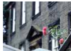
ブロンテ牧師館 (ハワース)

ギヤスケル(39)がシャーロット・ブロンテ(34)と知り合ってから5年足らずで、シャーロットは病死する。父ブロンテ師の依頼を受けたあと、ギヤスケルは精力的に『ジェイン・エア』の作者の足跡をたどり、1年8ヶ月でこの伝記を書き上げた。「シャーロットが、勇敢に、かつ信仰に堅く立って、試練を耐えとおしたことを描写する」と、ギヤスケルは彼女の親友に語り、原稿を読んだその人は、「シャーロットの生涯と性格が正確に記されている」と述べた。