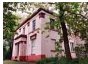
ブリマス・グローヴ(マンチェスター): 主な作品はこの家で書かれた。 現在はギaskell記念館。