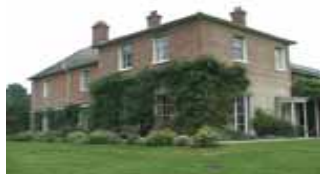
ローン(ホリボーン、ハンブシャ): この家で亡くなった。