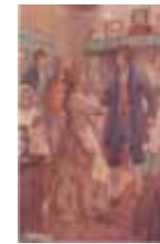
シルヴィア、チャーリー、 そしてフィリップ

物語は、18世紀末のイギリスの漁港モンクスヘイヴンを舞台に、酪農家の娘シルヴィアと、彼女を真摯に愛する洋品店の店員フィリップ、そして、彼の恋敵でシルヴィアと婚約する捕鯨船の鋸打ちチャーリー、の三人を軸に、フィリップを密かに慕うヘスタを絡めて、展開する。シルヴィアを得るためなら14年でも待つ覚悟のフィリップ。彼の想いは、果たしてシルヴィアにとどくのか。報われない愛に耐えるヘスタの人生はどうなるのか。「愛が真実なら、くっついて絶えることはない」—全編を流れる波の永遠性に絡めて、そんなメッセージが聞こえてくる。