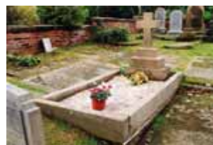
ナッツフォードのブルック・ストリート・チャペル内の墓地に、夫や娘たちとともに今も静かに眠る。