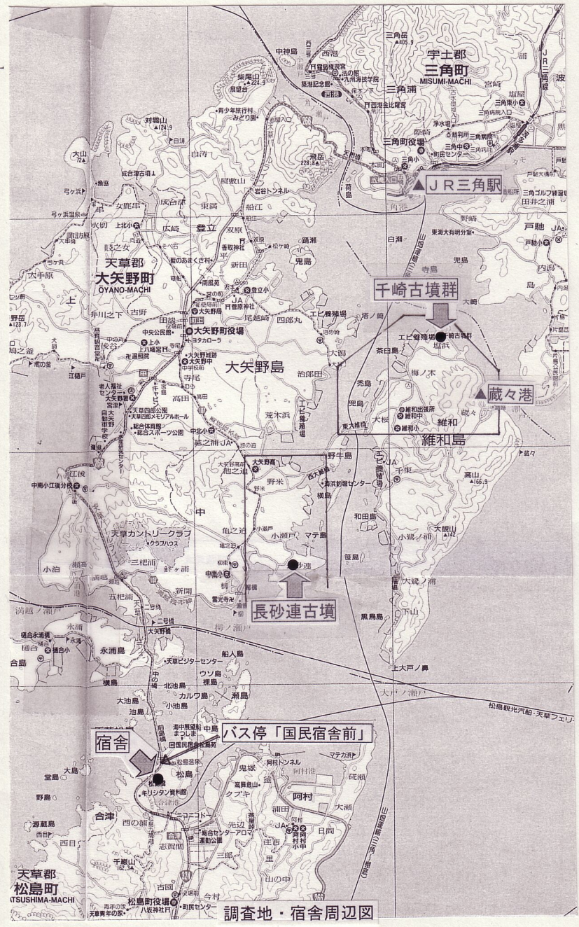
調査地・宿舎周辺図