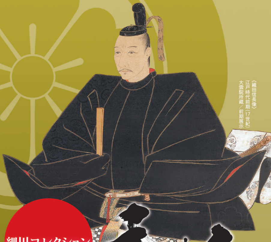
(織田信長像) 江戸時代前期(17世紀) 大雲院所蔵/前期展示